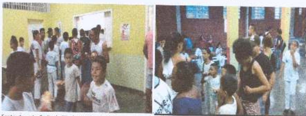
Foto 14: Distribuição de lanches as crianças e adolescentes do projeto.