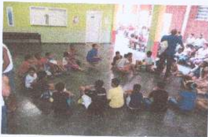
Foto 13: Atividades socioeducativos dinâmica e brincadeiras com crianças e adolescentes da comunidade.