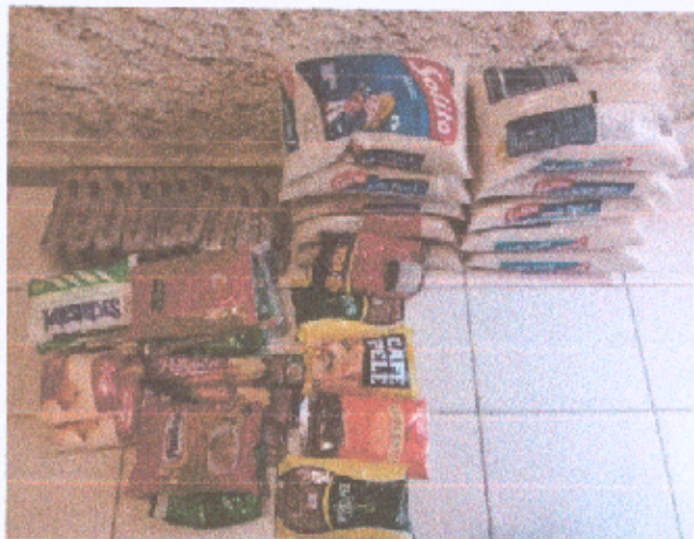
Foto7: Recebimento de doação de alimentos – campanha do alimento grupo do Alphaville e doações da Comunidade.