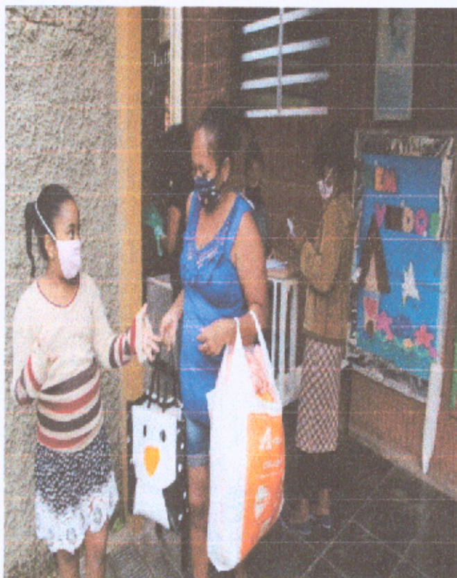
Foto 8: Acompanhamento familiar – Entrega dos alimentos às famílias assistidas