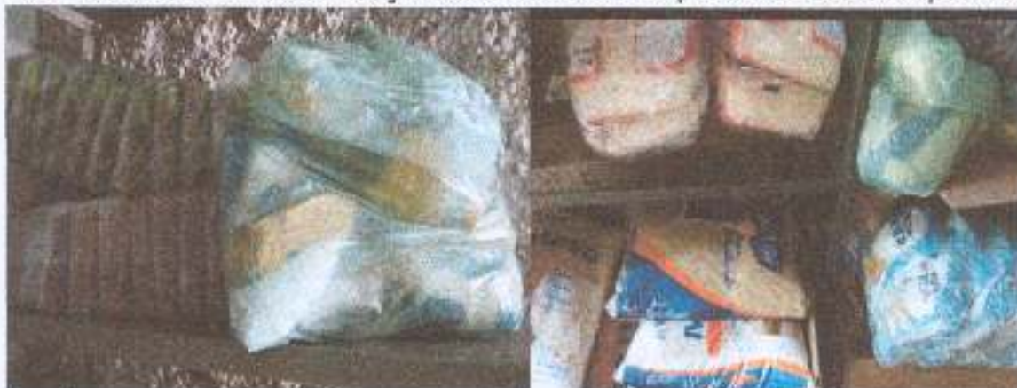
Foto 16: Recebimento da Doação de Alimentos - Grupo de voluntários Alphaville