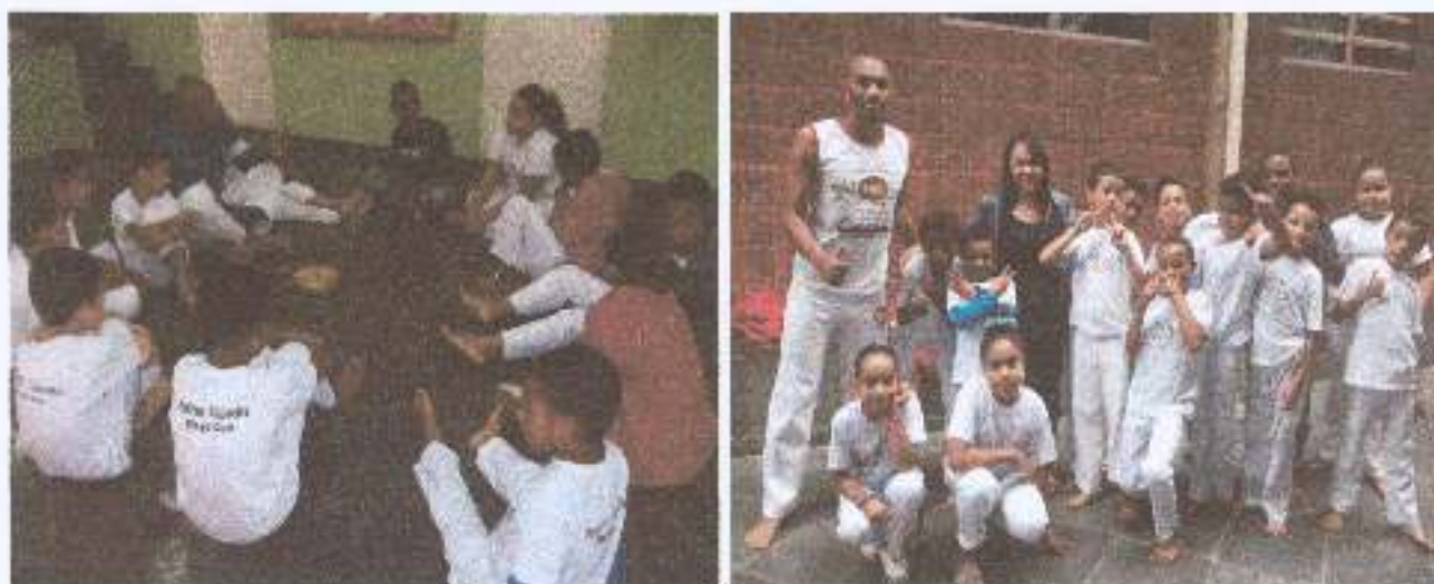
Foto 4: Atividade da Capoeira - aula da capoeira com crianças e adolescentes, assegurar referencia para o convívio, o desenvolvimento de relações de afetividade.