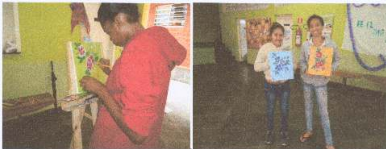
Foto 5: Atividade do artesanato – aula de pintura em tela, como possibilidade de construção de laços afetivos.