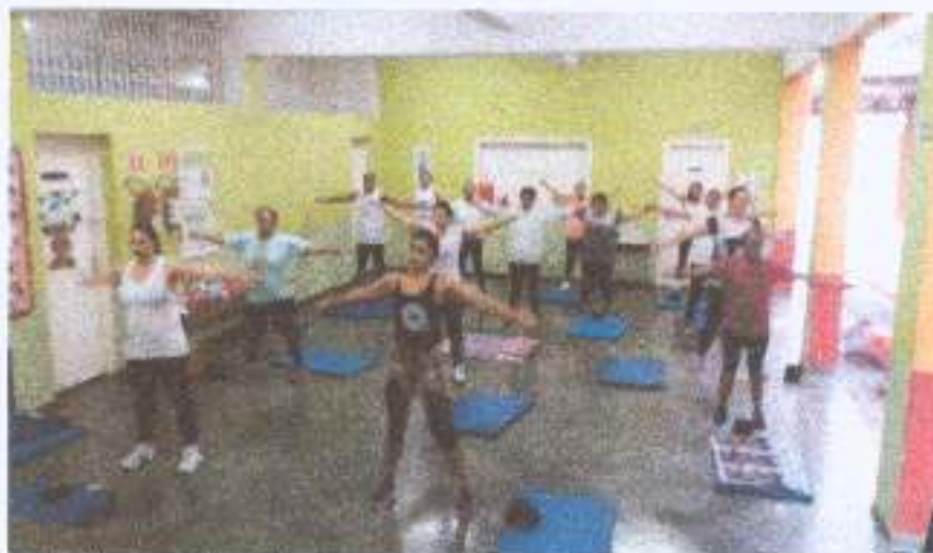
Foto 19: Aulas de ginásticas em parceria com a Secretaria de Esportes para mães da comunidade.