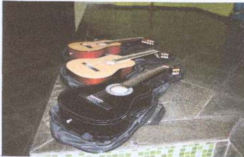
Foto 18: Recebimento de três violões doado por um voluntário da Equipe do Bem.