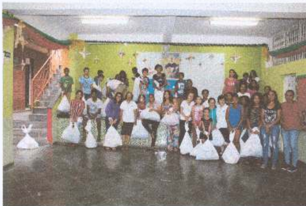
Foto 7: Comemoração da Festa de Natal – entrega dos presentes a criança/adolescente.