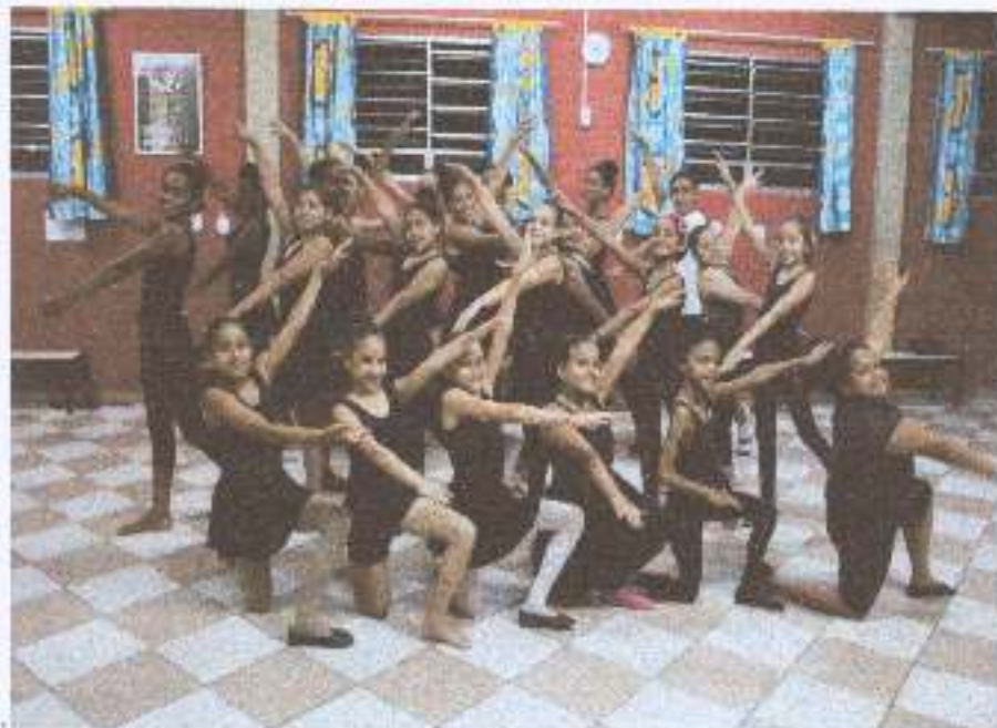
Foto 3: Atividade da dança com adolescentes – a dança como forma expressar sentimentos e emoções através de movimentos.