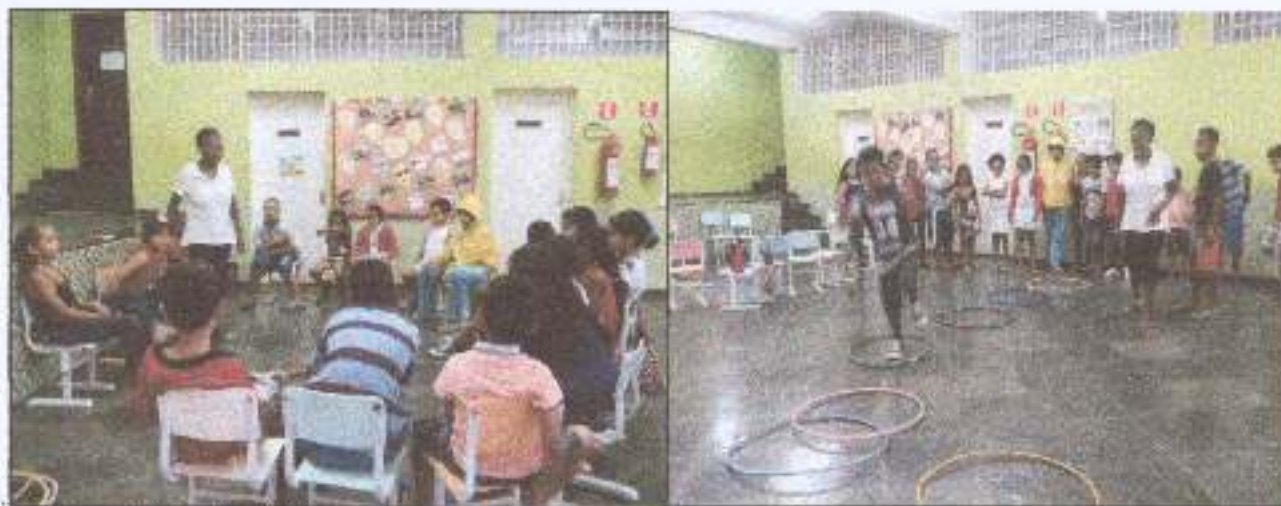
Foto 12: Atividades recreativas valorizando o lúdico e a inclusão social.