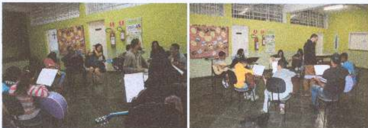
Foto 6: Atividade - aula de violão com adolescentes oferece oportunidade de desenvolvimento a inclusão social e redução da situação de vulnerabilidade social.