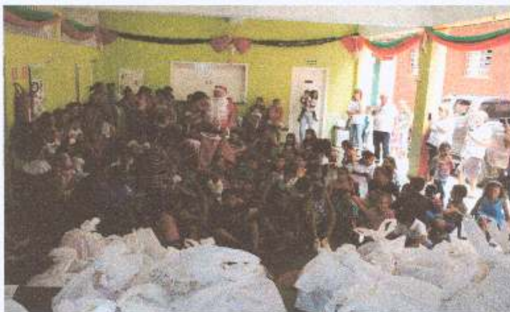
Foto 8: Comemoração da Festa de Natal – entrega dos presentes a criança/adolescente.