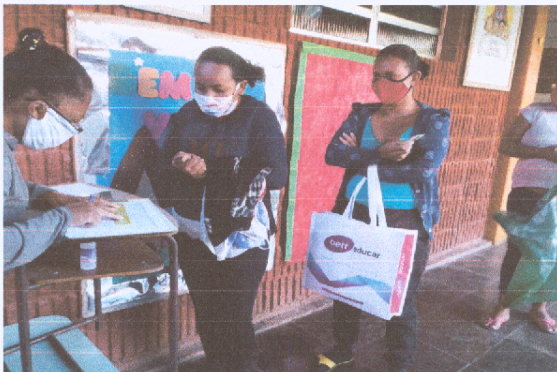
Associação Paula Elizabete, Itapevi