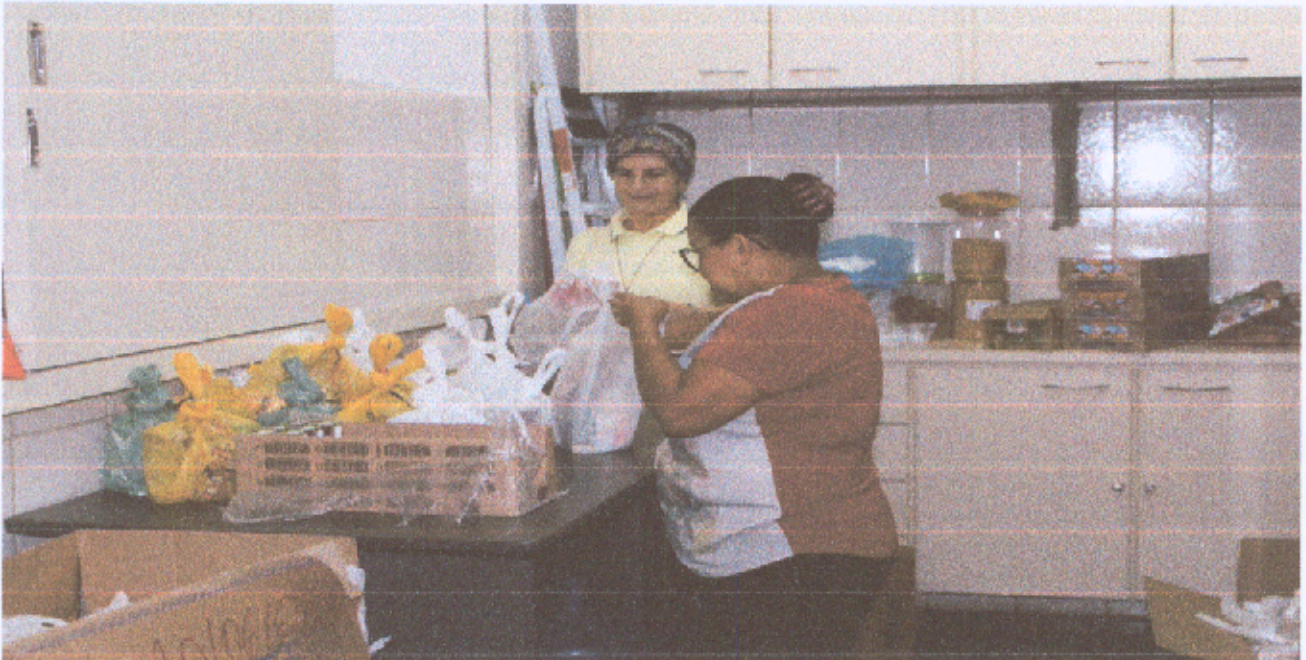
Foto 5: Confeção e entrega do lanche para as crianças das oficinas