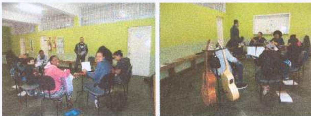
Foto 6: Atividades de música – Aula de violão contribuiu para as adolescentes, garantindo espaço de convivência e fortalecendo vínculos familiares.