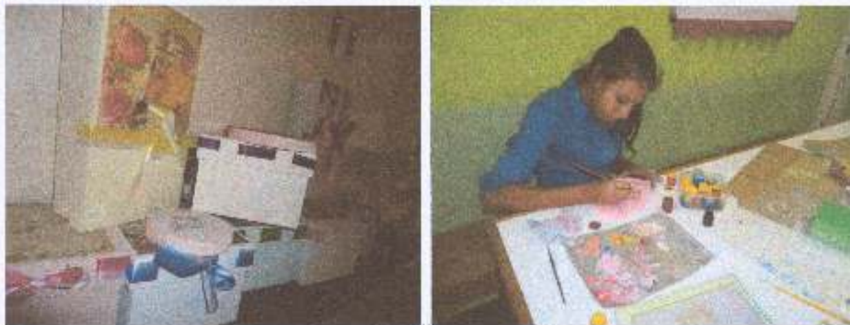
Foto 5: Atividade do artesanato - através da atividade de pintura possibilitar a construção de laços afetivos, socialização e fortalecimento de vínculos familiares.