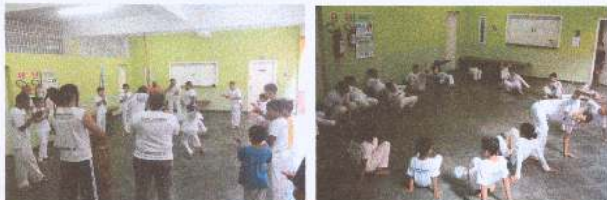
Foto 4: Atividade da Capoeira - aula da capoeira com crianças e adolescentes