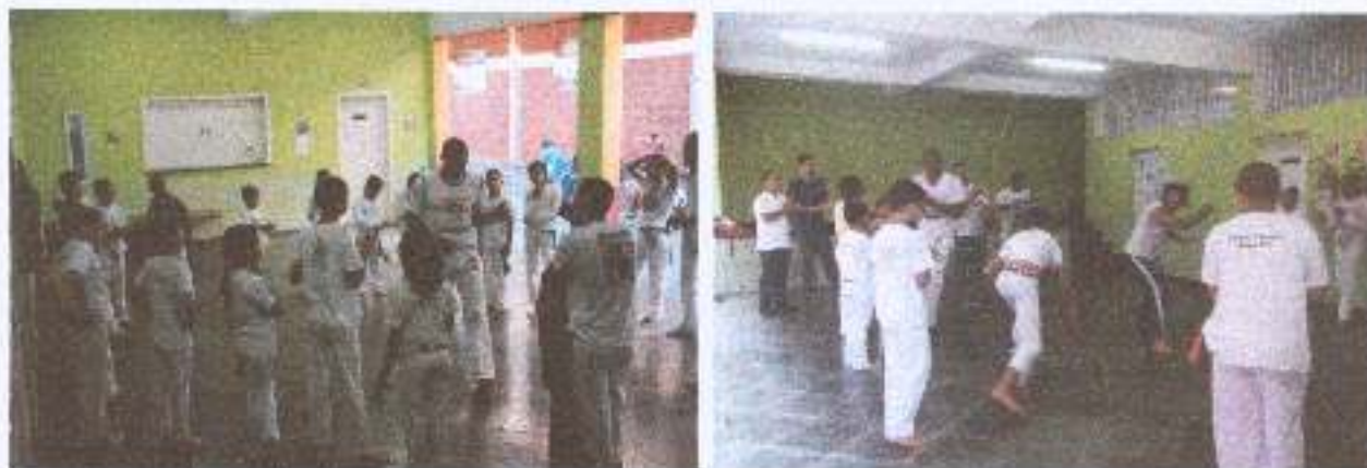
Foto 3: Atividade da Capoeira - aula da capoeira com crianças e adolescentes, contribuiu para a convivência e o fortalecendo vínculos familiares e sociais.